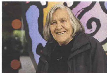
LetterAltura - Verbania - letteraltura.it

L a Barbagia e il Lago Maggiore. Universi senza punti in comune? Non proprio. Il filo rosso che li collega è costituito da due festival, diversi per luoghi e ispirazione, ma entrambi dedicati al mondo letterario. Ha un nome che è già un programma LetterAltura 2012 ( letteraltura.it ), dal 28 giugno al 1° luglio a Verbania sul Lago Maggiore e, poi, fino al 22 luglio nelle valli ossolane, una manifestazione dove protagonisti sono la letteratura di montagna, il viaggio e l'avventura. La formula di questa sesta edizione resta uguale a quelle passate: incontri con gli autori, spettacoli in tarda serata e un continuo dialogo con i lettori per approfondire, riflettere e divertirsi. Cinque percorsi tematici e 60 ospiti, tra i quali lo scrittore cileno Luis Sepúlveda, il regista polacco Krzysztof Zanussi, l'astrofisica Margherita Hack (foto in alto). Nelle stesse date, a Gavoi (Nu), antico paese della Barbagia, si tiene il festival let-