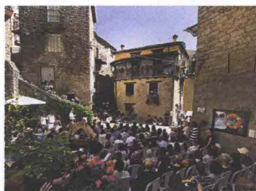
Isola delle storie - Gavoi - isoladellestorie.it

terario Isola delle storie ( isoladellestorie.it ), che inaugura la nona edizione la sera di giovedì 28 con uno spettacolo di David Riondino, accompagnato dal trombettista jazz Riccardo Pittau. Nelle giornate seguenti, incontri e dibattiti si articolano in diversi appuntamenti distribuiti nell'arco della giornata. Tra gli ospiti, la scrittrice statunitense di gialli Tess Gerritsen. E, per i più piccoli, da non perdere i reading delle 16: Marina Massironi dà voce alla favola futuristica di Christine Nöstlinger, Il bambino sottovuoto .