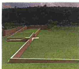
Álvaro Siza, Rovereto, Mart, dal 4 luglio al 15 gennaio 2015, mart.trento.it

«Percorrere un vicolo o una strada, dove c'è un contatto stretto tra interno ed esterno, è molto speciale, molto ricco. E questo influisce sulla mente e sul cuore di chi progetta e disegna»