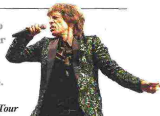
Rolling Stones, 14 on Fire Tour

Come diceva Nino Castelnuovo? 40 anni e non sentirli. Per Mick Jagger e gli altri bisogna aggiungere tre decenni. Vedere per credere, il 22 giugno, a Roma, al Circo Massimo.