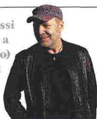
Vasco Live Kom 014

In attesa del nuovo album, Vasco Rossi torna dal vivo con sette concerti: tre a Roma, all'Olimpico (25, 26, 30 giugno) e quattro a Milano, a San Siro, la sua seconda casa (4, 5, 9, 10 luglio).