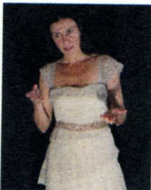
Lo spettacolo del Teatro Blu

Un omaggio al maestro Gian Carlo Menotti, il fondatore del Festival dei Due Mondi di Spoleto. A ricordare il festival (battezzato "Piccola Spoleto") è il compositore e librettista nel centenario della nascita è Cadegliano, in provincia di Varese, suo paese natale. Si comincia domenica 3