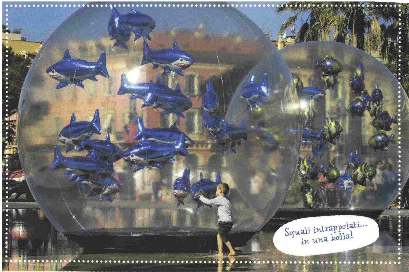
Squali intrappolati... in una bolla!