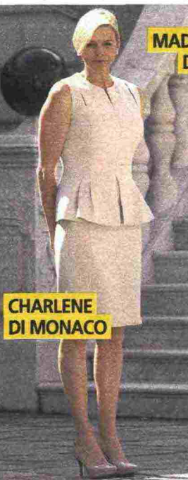
CHARLENE DI MONACO